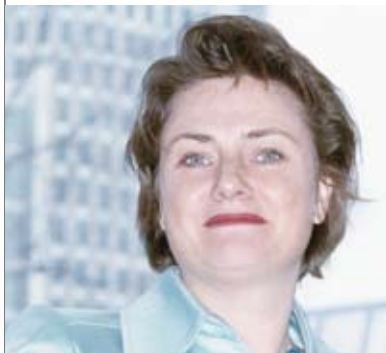
Karien van Gennip De Staatssecretaris van Economische Zaken